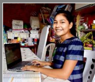
LAPTOPS VOOR STUDENTEN